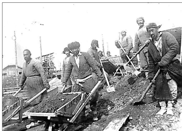
Трудармейцы из Таджикистана на строительстве объекта на Урале

Жители республики голодали. Это объяснялось тем, что посевы продовольственных культур были сокращены для выращивания посевов необходимого для фронта хлопка.