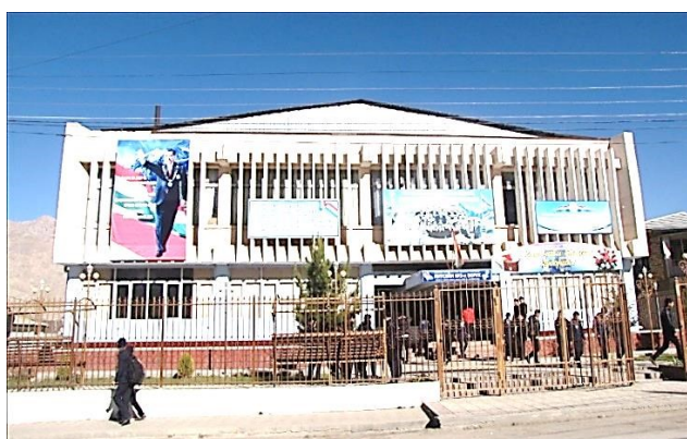
Здание лицея № 3 с. Ворух

В Таджикистане изучают традиции русской культуры, но неглубоко. Во второй половине 1-го класса начинаются уроки русского языка два раза в неделю. В лицее № 3 г. Исфары учится 529 детей, из них 77 – девочки. Почти все выпускники лицея благодаря своим знаниям поступают в высшие учебные заведения, причем многие – в российские вузы. 14 человек из числа бывших учеников нашей школы защитили кандидатские диссертации, почти все ученую степень получили в России. В лицей поступают по конкурсу, поэтому в лицее учатся самые одаренные дети.