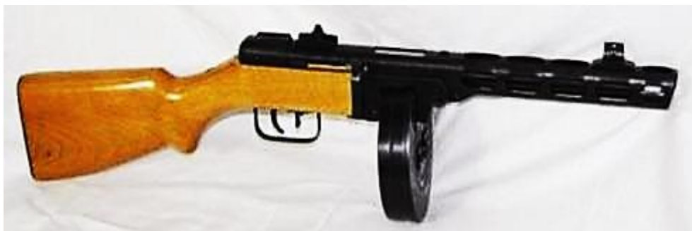
Рис. 1. ППШ, который производили на Бакинском авторемонтном заводе

Баку в первой половине 1942 года на машиностроительном заводе имени Держинского выпускали пистолет-пулемет Шпагина, и это оружие советские воины активно применяли в битве за Кавказ. На бакинском авторемонтном заводе выпускали детали для сборки ППШ.