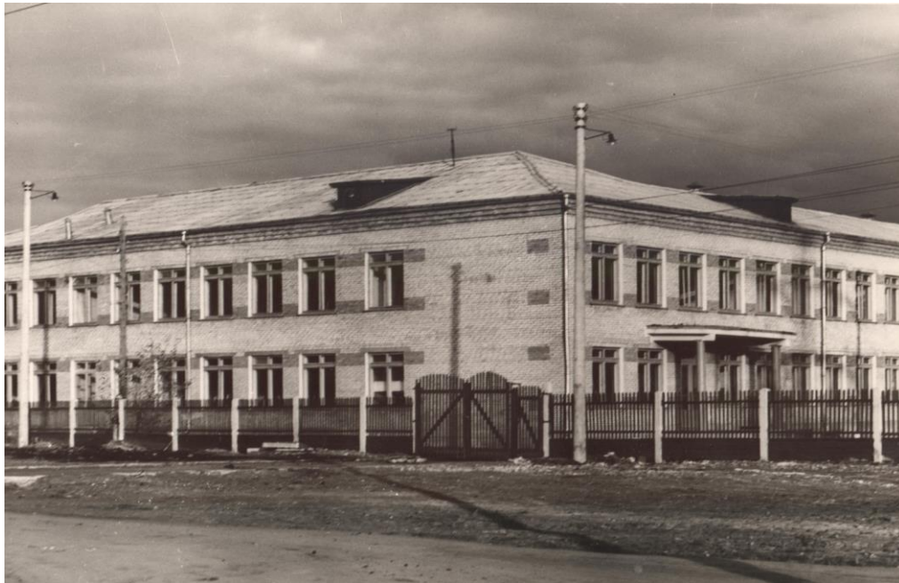
Здание ПЛ № 31 г. Узловая

Печатать свои работы начал с 1946 года. В 1954 году окончил факультет журналистики МГУ. Распределение получил в столичную газету «Гудок». В «Гудке» Чивилихин проработал с 1951 по 1954 год, здесь были опубликованы его очерки о железнодорожниках и работниках Московского метрополитена. В дальнейшем Чивилихин работал в газетах «Вечерняя Москва», «Комсомольская правда», где прошёл путь от литературного сотрудника до члена редколлегии. С середины 1950-х годов писательский труд становится основным. В 1957 году вышла его первая книга «Живая сила».