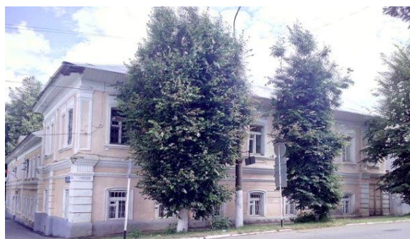
ныне ул. Ленина, д.3 – здание администрации МО