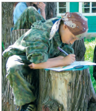
Участник конкурсной программы на 62-м Первенстве