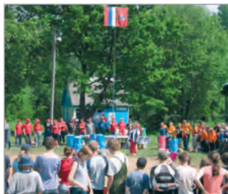
Линейка в Доме юного туриста, посвящённая закрытию 63-го Первенства