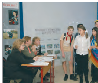
На конференции «Из дальних странствий возвратись»

В качестве жюри приглашаются опытные краеведы и путешественники, профильные специалисты, кандидаты наук, историки, культурологи, геологи, биологи, географы, педагоги и руководители образовательных учреждений. Желающих принять участие в этом конкурсе с каждым годом становится всё больше, так как лауреаты и дипломанты направляются для участия в других городских и всероссийских конкурсах, слётах и олимпиадах.