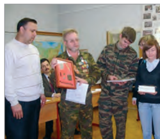
Вручение солдатского медальона родственникам найденного бойца