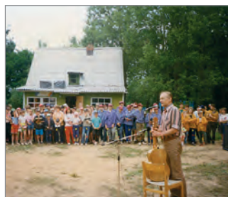
Актёр М. И. Ножкин выступает на закрытии 50-го Первенства. 1995 год