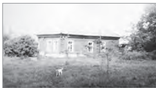
Так выглядел Дом юного туриста летом 1941 года