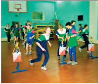
В спортивном зале МосгорСЮТур идёт подготовка ориентировщиков к Всероссийским соревнованиям

Спортивное ориентирование в странах Скандинавии называют видом спорта здорового народа, в мире спорта — шахматами на бегу. В последние годы оно получило широкое развитие в системе физического воспитания и оздоровления учащихся Москвы.