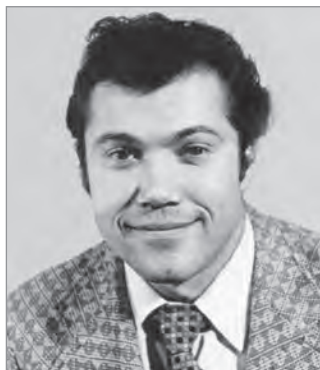
А. И. Ляпунов

Лучшие экспедиционные отряды школ № 540 Пролетарского, № 583 Ленинского, № 43 Гагаринского, № 446 Первомайского районов, отряд красных следопытов МГДПШ достойно представляли Москву на Всероссийском слёте актива туристско-краеведческой экспедиции пионеров и школьников «Моя Родина — СССР», а геологические школы при МГУ — на VI Всесоюзном слёте геологов в Иркутске.