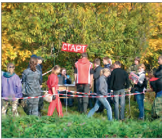
Соревнования по спортивному ориентированию на полигоне в ДЮТе