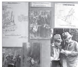
Спортивное ориентирование. Фото 1961 года

В 1969 году Станция вновь переезжает. На этот раз в помещение бывшей школы в Серебряном переулке на Арбате. Номинально всё здание переходит на баланс ДЭТС, но на самом деле туда переезжает «арендатор» – Городской отдел народного образования (ГорОНО).