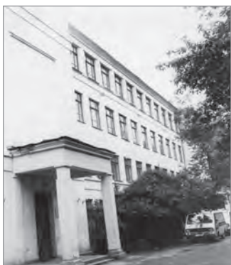
Наши соседи — подстанция «Скорой помощи»

Слабое финансирование из бюджета заставило многие организации переходить на хозрасчётную систему. Внешкольные учреждения расширяли платные услуги и закрывали отделы туризма. Резко уменьшилось количество походов. В 43-м Первенстве участвовало только 37 команд. Из 60 внешкольных учреждений туризм культивировали чуть более 20-ти. Сократилось количество школьных музеев, рассказывающих о боевом пути отдельных воинских