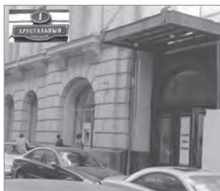
Первое размещение Станции – Хрустальный переулок, 1, помещение 90

Все предвоенное пятилетие Станция занималась организацией турбаз, палаточных лагерей, автобусных экскурсий. Станция создаёт временные базы в Подмосковье (в Мещёре, в Папортниках, в Бородино, в Истре) и в других