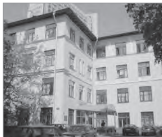
Здание МосгорДЭТС в Серебряном переулке в 1975 году

Считая туристскую деятельность непременным элементом