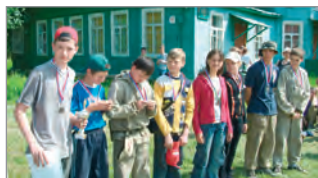
Награждение команд 62-го Первенства