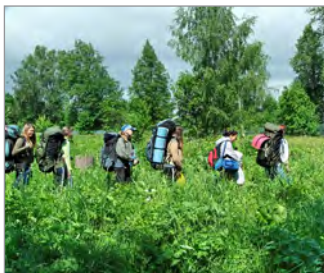
Выходим на маршрут...