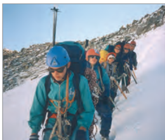
К перевалу по снегу. Алтай, поход 4 к. с.

Многое из того, что делали «первопроходцы», сейчас стало обычным. Московскими туристами обжиты реки Тумча, Писта и Кереть в Карелии, Ока-Сибирская и Она. В маршруты 3–4 категории сложности водят ребят