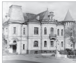
Дом пионеров и школьников Бауманского района