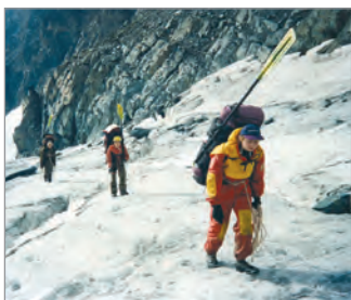
Алтай. Поход 4 к. с.