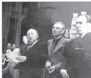
Слева направо: актёр Осип Абдулов, писатель Сергей Михалков, актёр Ростислав Плятт в гостях у юных туристов

Исправно работает сложившаяся система туристских соревнований и система подготовки кадров. В районах начинается специализация по ви-