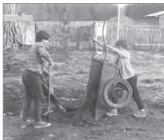
Трудовой десант детских объединений в ДЮТе

Сейчас загородная база может принимать более 500 человек одновременно. Она стала учебным полигоном для детских объединений Москвы, а также местом проведения городских массовых мероприятий