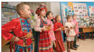
Конкурс презентаций музеев образовательных учреждений г. Москвы.

Постоянно идет регистрация школьных музеев. Ежегодно через неё проходит около 200 музеев.