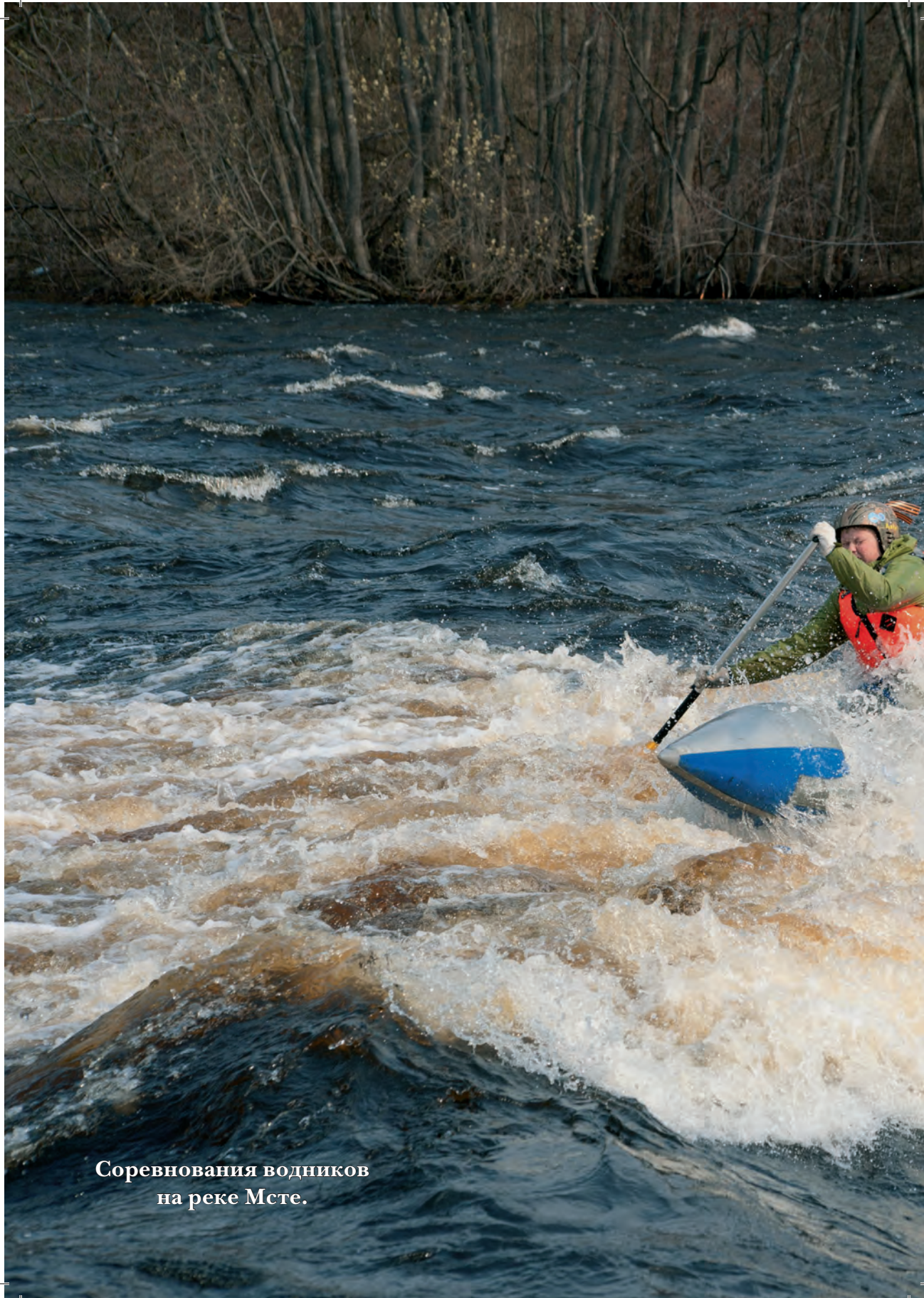
Соревнования водников на реке Мсте.