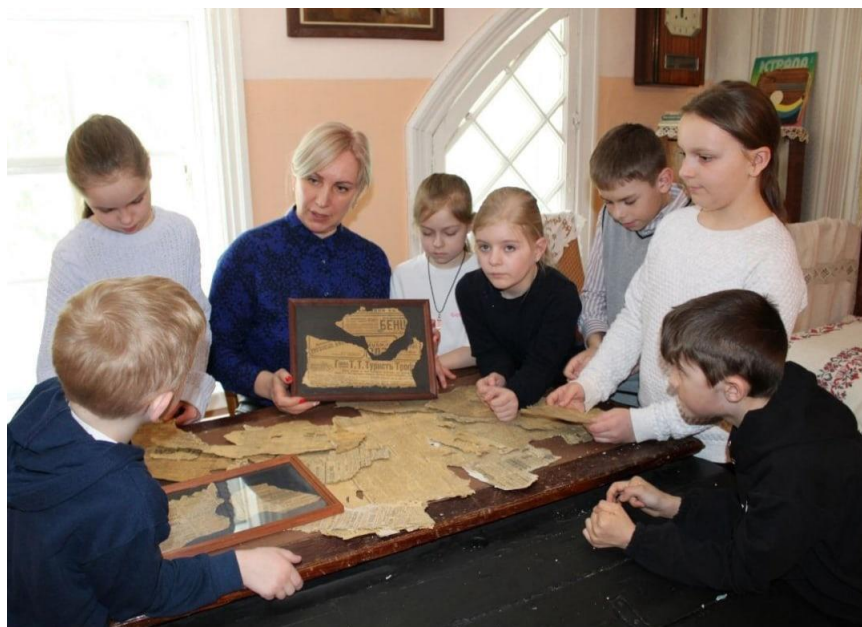
Занятия музейной группы

Изучаем край родной. Организация походов – неотъемлемая часть работы музея