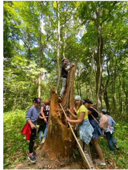
Организация и проведение тематических мероприятий