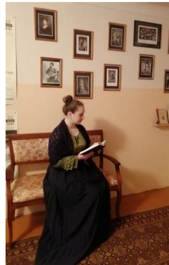
Театрализованное представление в музее, посвященное дню рождения Гликерии Федотовой