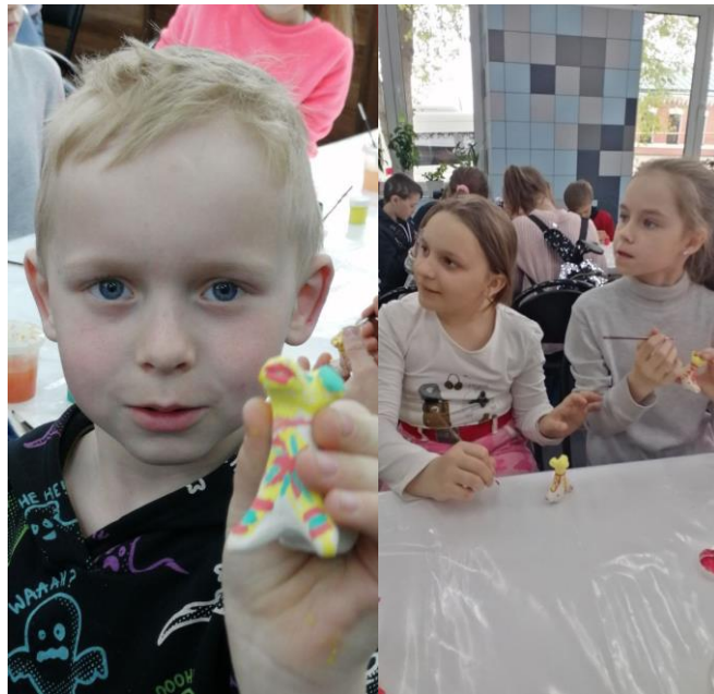
Музей организует экскурсионные поездки и мастер-классы