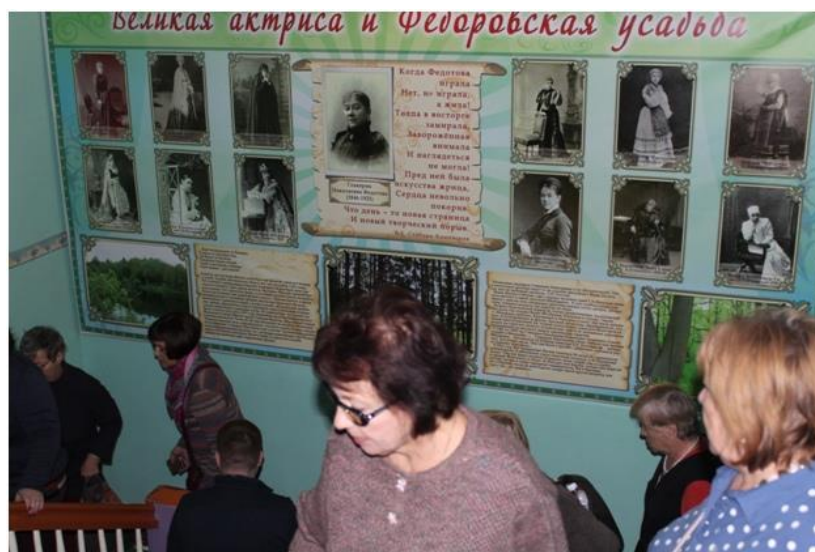
Встреча гостей и организация экскурсий по музею