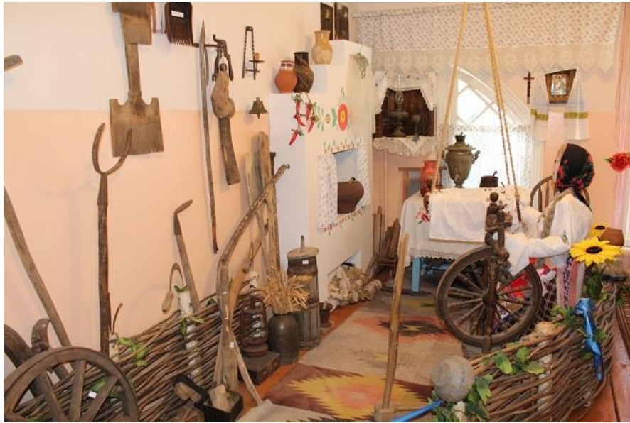
Уголок деревенской избы;